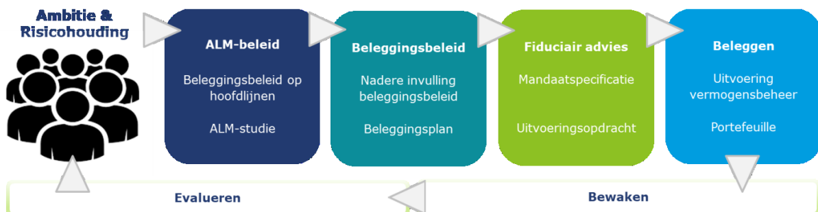
Afbeelding: Het beleggingsproces in zeven stappen

Het doel van het beleggingsproces van het pensioenfonds is het beleggingsbeleid op consistente wijze vorm te geven en uit te voeren en kent de onderstaande zeven stappen.